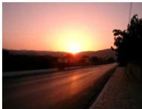
Takaisin Elämään -yhdistyksen tekemä nuorisotyö alkoi vuonna 2000.

T akaisin Elämään -yhdistys on perustettiin syksyllä vuonna 2000. Yhdistyksen alkuperäinen perustamistarkoitus oli auttaa nuoria kokonaisvaltaisesti heidän ongelmissaan. Tässä samassa tarkoituksessa olemme edelleen jatkaneet. Paljon työtä on jo tehty, mutta paljon on myös vielä teke-mättä. Yksi keskeisimpiä päämääriä on perustaa toimintakeskus, joka auttaisi ison askeleen eteenpäin tässä työssä.