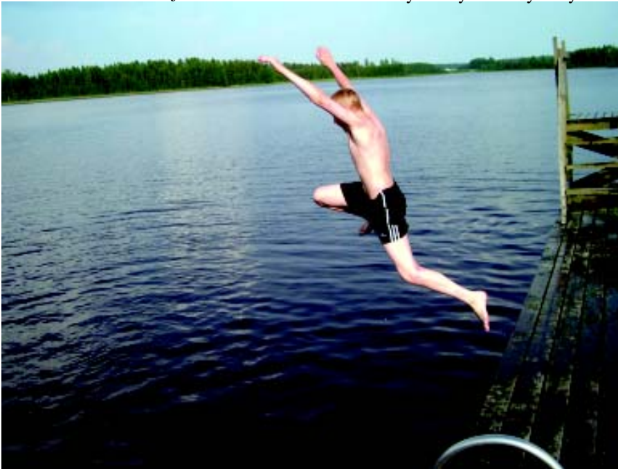
Järven rannalla oleva leirikeskus tulisi tarpeeseen.

Meille ei ole mikään yllätys, että leirikeskuksen kauppaa ei ole vielä virallisesti solmittu. Myyjänä kun on kaupunki tai kunta, löytyy aina valittajia, jotka eivät hyväksy kauppaa, ts. tämän kaltaista työtä tai omistajia lähelleen. Toivomme, että valitukset saataisiin nopeasti käsiteltyä ja kauppakirjat pystyttäisiin allekirjoittamaan hyvissä ajoin ennen kesää.