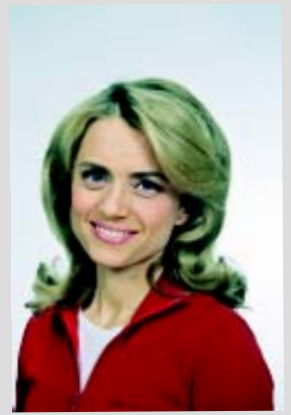
KD:n eduskuntaryhmän pj. kansanedustaja Päivi Räsänen