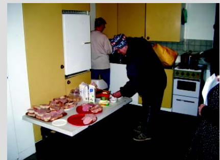
Maanantaiaamuisin on Koivukylässä ollut tarjolla aamiaista: puuroa, voileipiä ja kahvia. Kävijäkeseuranta oli n. 40.

Vantaan toimipisteessä on järjestetty yhteistyössä Keravan City-seurakunnan kanssa jo puolentoista vuoden ajan maanantaiaamuisin ilmainen aamiaisen, ns. "puuropolku" alueen opiskelijoille ja vähävaraisille. Puuropolku on katkolla, koska osa vapaaehtoisista työntekijöistä on lopettanut. Etsimme uusia vapaaehtoisia tähän työhön. Ota yhteyttä jos olet kiinnostunut, niin kerromme lisää.