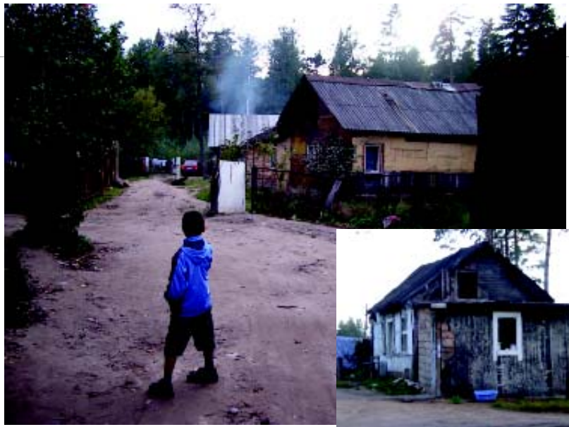
Talot Gertemai kylässä ovat erittäin huonokuntoisia sekä sisältä että ulkoa.

Kylän kuoppaista hiekkatietä parin minuutin välein ajavat taksit kuljettavat huumeasiakkaita eri puolilta Vilnaa. Poliisi seuraa usein tapahtumia autostaan "kylän portilla" puuttumatta tilanteeseen.