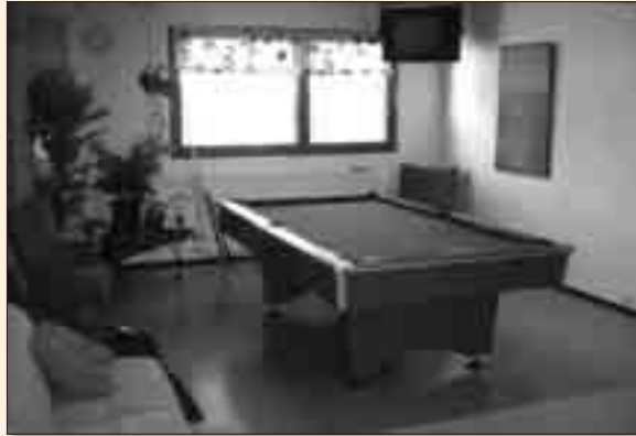
Vankilasta vapautunut on tervetullut Vantaan toimipisteeseen keskustelemaan tai vain vaikka biljardia pelaamaan.

veluja rakentaen polkua palveluihin, päihdekuntoutukseen ja sosiaaliseen kuntouttamiseen. Lisäksi järjestämme tukiohjelmaan tuleville nuorille asunnon, arjen toimintoja, kuten työpaikan, sekä toimimme tukihenkilöinä. Projekti lisää vapautuvan vangin mahdollisuuksia selvittää arjessa ilman uusintarikollisuutta, päihteitä, asunnottomuutta ja jopa työttömyyttä. Projektin päämäärä on osaltaan lisätä pääkaupunkiseudun turvallisuutta ja asumisviihtyvyyttä sekä tuoda huomattavia säästöjä yhteiskunnan usealla eri osa-alueella. Lisätietoja projektista saa Vantaan toimipisteeseen (yhteistiedot takasivulla). PS. Seuraavassa uutislehdessä Vapaa valinta –projektin asiakashaastattelu.