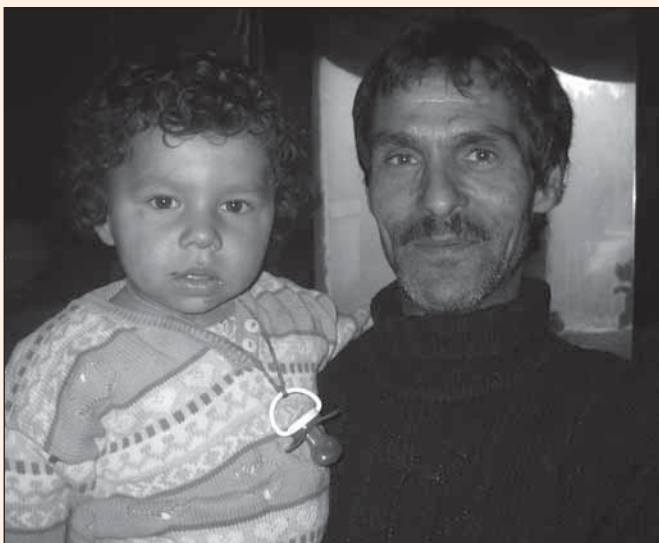
Mies ja tytär on saaneet projektin aikana säännöllisesti ruoka- ja vaateapua.

Tarve tarttua Liettuan Vilnassa sijaitsevan Taabor-kylän reilun viiden sadan asukkaan tilanteeseen kietoutuu huumeongelmaan, joka on tuonut mukanaan rikollisuutta, riippuvuutta, väkivaltaa ja vanhemmuuden puutetta. Huumeidenkäytön takia kylässä lojuu maassa tuhansia huumeneuloja, jotka aiheuttivat vakavan terveystarpeen etenkin lapsille, joita kylässä asuu yli 150. Huumeakaupasta aiheutuvien haittojen vähentäminen otettiin yhdeksi päätavoitteeksi. Kylän elinolosuhteet olivat myös olemattomat. Kylää voikin sanoa hökkelikyläksi yhtään liioittelematta. Taloissa ei ole wc- tai peseytymistiloja lainkaan ja talojen lämmittäminenkin suoritetaan polttopuilla itse kyhätyissä takoissa. Sähköä tulee vain yhteen tai kahteen omatekoiseen lamppuun, jos sähkölasku on maksettu. Päättävät viranomaiset ilmaisivat kyllä halukkuutensa tehdä asioiden hyväksi jotakin, mutta puheet ja teot eivät useinkaan kohdanneet toisiaan.