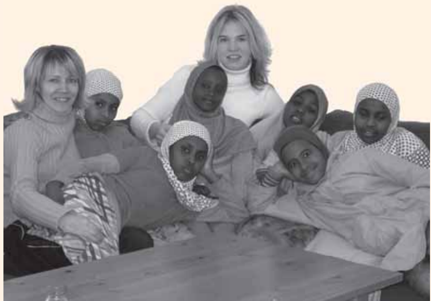
Suosituksen tyttökerhon jatko on vapaaehtoisten varassa.

Projektin jälkeen Ystäväsillan olohuoneessa monipuolinen toiminta jatkuu. Kevään aikana järjestettiin kerhoja tytöille ja kesäkuusta lähtien viikoittaista toimintaa naisille. Kerran viikossa toimitiloissa kokoontuu myös englannin kielen kerho somalialaisille. Toimintaa toteutetaan pääasiassa vapaaehtoisvoimin, koska saatu jatkorahoitus on jäänyt liian pieneksi.