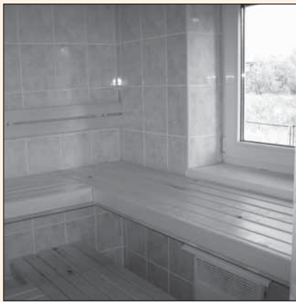
Saneerasimme suihkutiloihin kaksi saunaa naisille ja miehille.