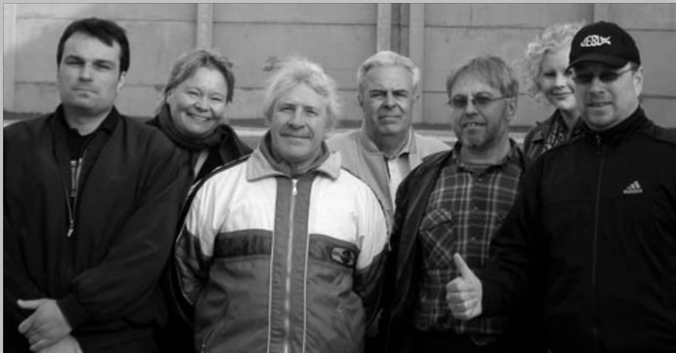
"Avustusryhmämme vieraili Liettuan Alustys nimisen paikkakunnan vankilassa tapaamassa kylän romaaneja ja pitämässä hengellisen tilaisuuden".