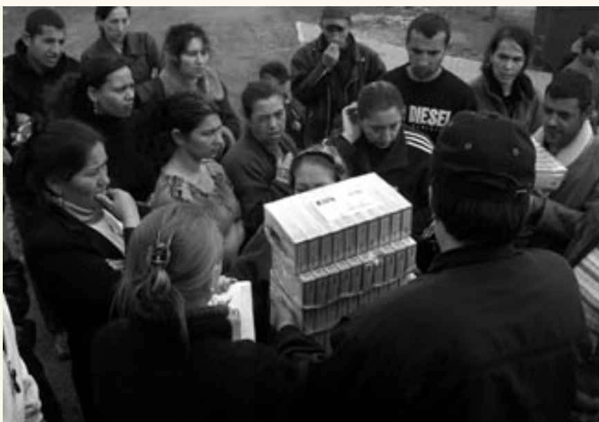
"Korson ruokapalvelu ry:n kautta veimme kylään 1000 kg (16.000 kpl) tuoreita pihvejä"

Kylän saunan rakentamiseen on Ulkoministeriön, joka on päärahoittaja, rahaa käytettävissä vain rajoitetusti. Koska emme heti alussa hakeneet kohdennetusti rahaa rakentamiseen, ei projektirahoitus yksin riitä kulujen kattamiseen.